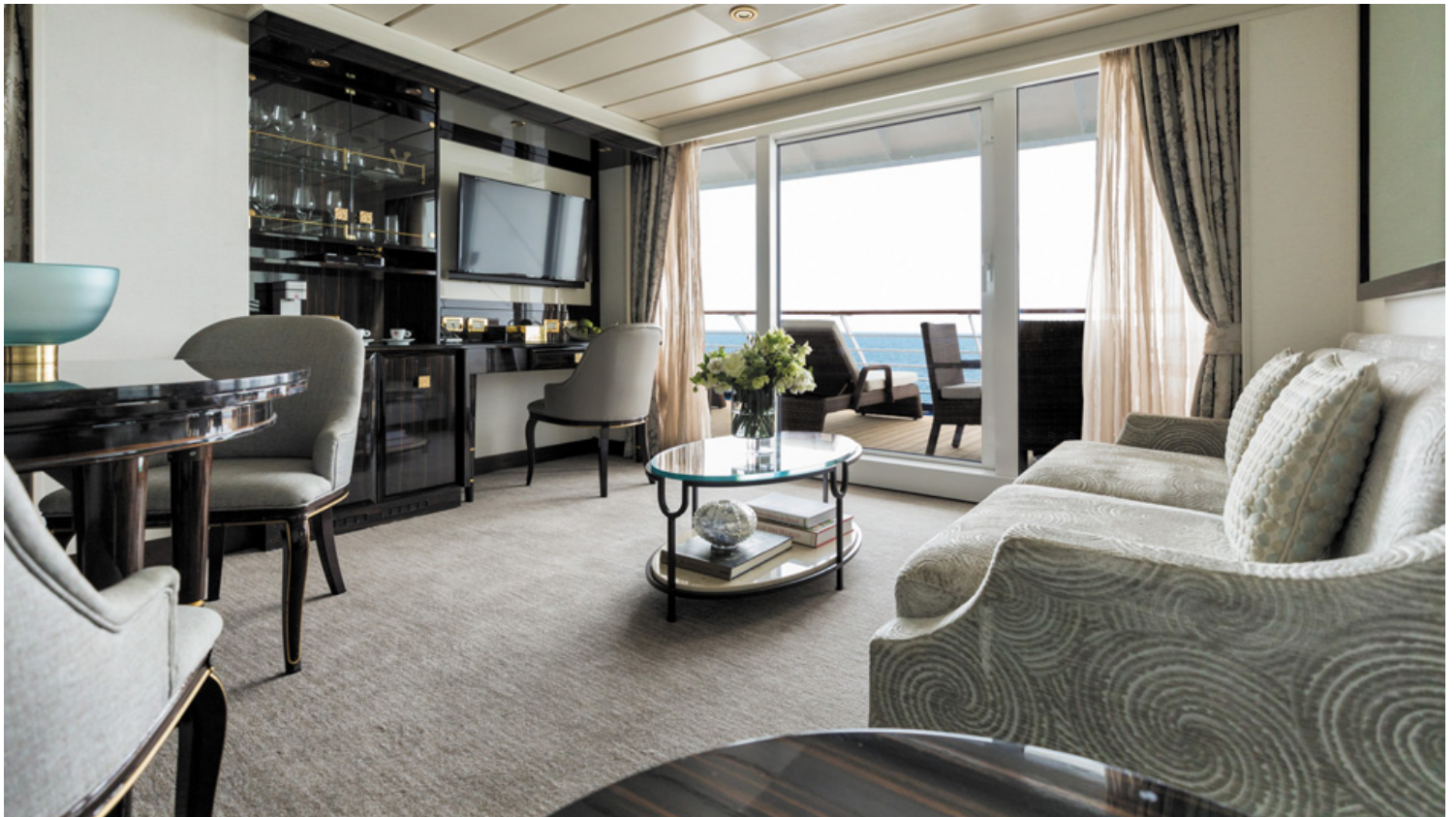
פנקו את עצמכם בסוויטה מפוארת מיקום, מיקום, מיקום

אחד השיקולים לבחירת המיקום הוא הפעילות שאתם מתכננים לעשות. האם אתם אנשים של חדר כושר וספא ? אנשי בריכה ? אוהבי צפייה בנוף ? עיינו במפת הסיפונים כדי למצוא את החדרים הקרובים ביותר לפעילות המתוכננת. לעומת זאת, אם אתם מעדיפים שקט ושלווה, תרצו בוודאי לבחור את החדר המרוחק ביותר מהבריכה. כולם מעדיפים להיות בקרבת המזנון החופשי אם כי ברוב המקרים הוא נמצא בירכתיים ובסיפון הבריכה. לעומת זאת, התיאטרון באוניות נמצא בחרטום האונייה, למעט מקרים נדירים.