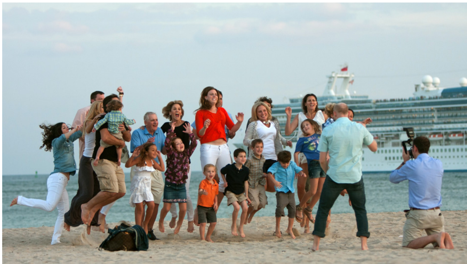
משפחות בקרוזים. עלויות

במקרה ואתם מוגבלים בתקציב, הזמנה מוקדמת תוכל לעזור בבחירת החדר המועדף במחיר הטוב ביותר.