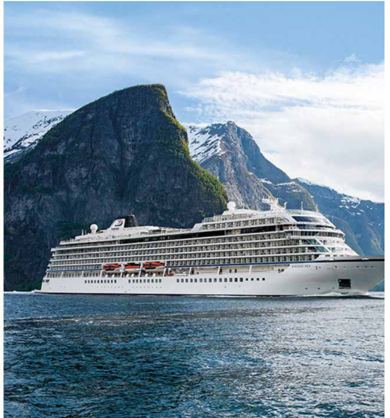
הפלגות ים ונהרות.

לאחר התרחבות החברה משייט נהרות למסעות באוקיינוסים, Viking עשתה קפיצת מדרגה נוספת בשנת 2024. החברה, בראשות היו"ר טורשטיין האגן , יצאה להנפקה במאי. כעת היא נסחרת בבורסת ניו יורק תחת הקוד "VIK".